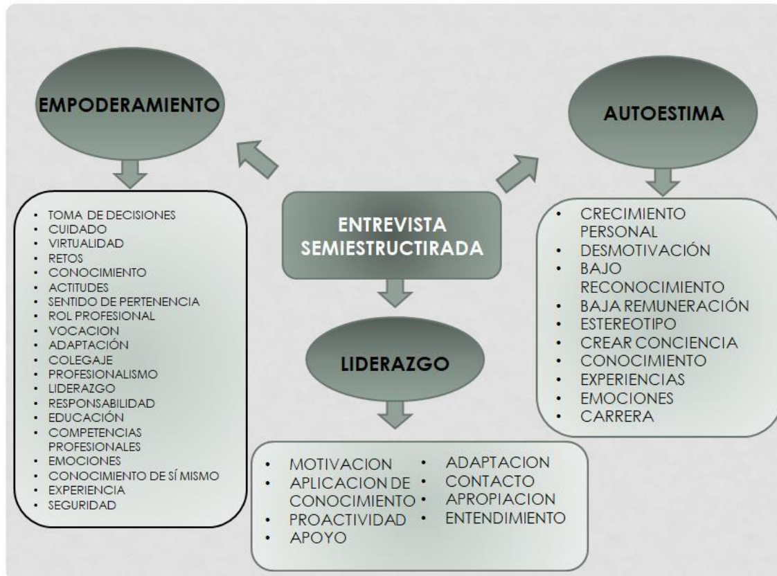
GRÁFICA #1: Categorías emergentes y sub emergentes identificadas en la entrevista semiestructurada realizada a los estudiantes de enfermería.

Al realizar la entrevista semiestructurada con los estudiantes de enfermería cursando 3to a 8vo semestre, se formularon una serie de preguntas las cuales fueron planteadas con tres variables principales, que son: empoderamiento, liderazgo y autoestima, (ver gráfica 1) en donde por cada pregunta planteada fueron seleccionadas diferentes emergentes y sub emergentes en relación con las respuestas dadas por los estudiantes. Identificamos que en las preguntas planteadas con